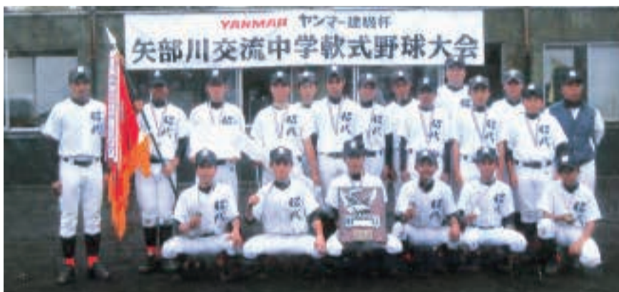
写真は昨年第19回の優勝校 昭代中学校(柳川市)

ヤンマー建機杯第20回矢部川交流中学軟式野球大会が4月9日(土)、10日(日)、16日(土)福岡県、筑後市、八女市、広川町、柳川市、みやま市の各教育委員会の後援とヤンマー建機株式会社の地域支援活動の特別協賛を頂き本年は27チームの参加で開催します。みなさんの応援をお願いします。開会式4月9日(土)8時30分ヤンマー建機野球場(雨天時会場変更)