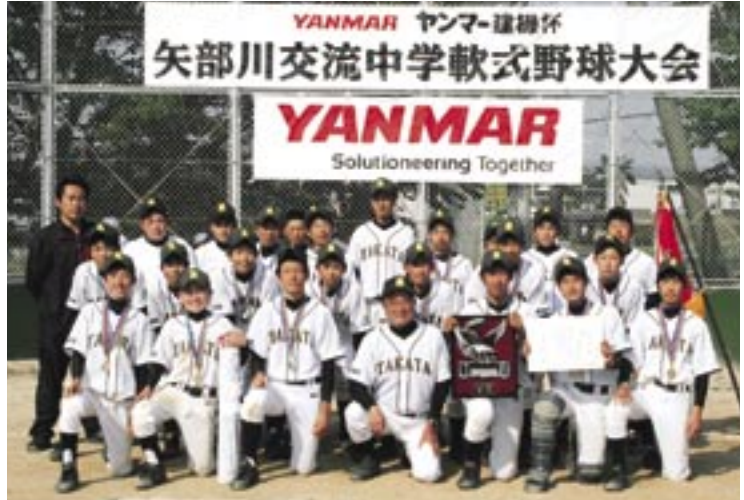
写真は昨年の優勝校高田中学校(みやま市)