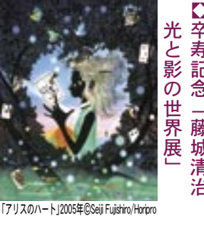
「アリスのハート」2005年 ©Seiji Fujishiro/Horbro

光と影で幻想的な世界を生み出す「影絵」を芸術として浸透させた影絵作家の第一人者、藤城清治の世界を紹介するもので、福岡市では初の本格的な展覧会となります。