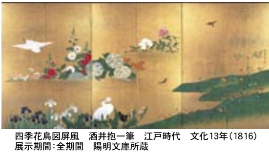
四季花鳥図屏風 酒井抱一筆 江戸時代 文化13年(1816) 展示期間:全期間 陽明文庫所蔵

す。手づくりーこれは孫の節句を祝ってやる婆さんの何よりの贈り物であり、また冬の夜長のよなべの楽しみでもありました。「正月過ぎツト直グ取り掛カリヨリマシタバノ」。