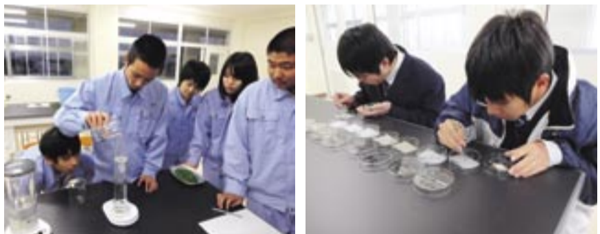
調査・実験の様子

研究成果の発表では、九州大会に3年連続出場して、25年度優秀賞を戴きました。この活動から国立大学農学部への進学を決意し、3年間で4名の生徒が進路実現を果たすことができました。リレー方式でつなぐ研究の根底にあるのは、農業高校生として学んだことを地域貢献に活かしたいという願いです。今後も体験しながら学び、考え、そして地域に貢献できるように頑張っていきます。