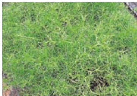
左上:本葉4枚時。この頃に最終株間(10cm前後)にする。