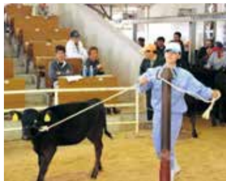
生物利用科3年動物科学専攻生