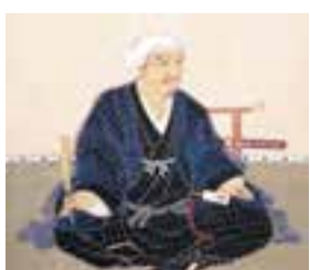
黒田如水(官兵衛)像 江戸時代後期19世紀 福岡市博物館蔵

各イベント共抽選によりペア5組の方へ招待券プレゼント。希望の方はイベント名を明記の上(株)東兄弟宛ハガキで応募下さい。締め切り 7月10日。