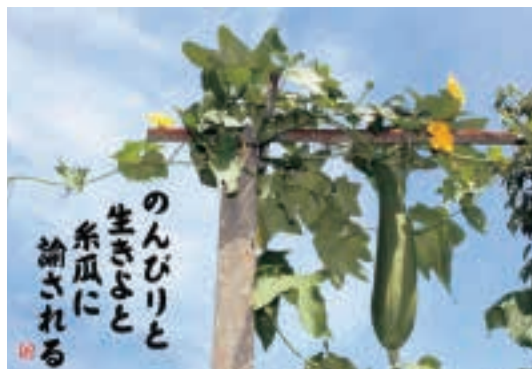
のんびりと 生きよと 糸瓜に 諭される

どの道を行っても同じ所へ着く老いの坂なのに、ゆっくりにしたい余生が忙しい。もう後は、自分のためにある余生です。ギア一つ落として、のんびりと生きなさいと、揺れる糸瓜に諭される。ゆっくりの歩幅が似合う高齢者なのだ。