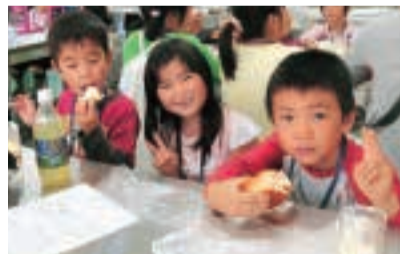
バター作りと試食

これからもたくさん子どもたちに、農業の楽しさや食・命の大切さを大いに感じてもらいたいと思います。