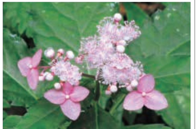
(黒木町) 松尾 重根

クサアジサイは多年草で、6月頃に咲く紫陽花(あじさい)とは別種。矢部村では釈迦・御前岳周辺のブナ林縁部のやや湿った林内にひっそりと咲いている。開花は8~9月頃。花は淡紅色で、小さい方は両性花、3枚の大きい萼片(がくへん)を持つ方は装飾花(中性花)。