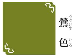
鶯色 うぐいすいろ 視覚デザイン研究所「和の色のものがたり」より