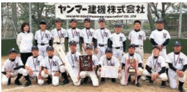
準優勝校 八女西中学校(八女市)