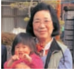
筑後市西牟田 重富 緑

絵手紙には前から心惹かれるものがあり... 機会を得てサンコアの「てくてく絵手紙教室」に入会しました。