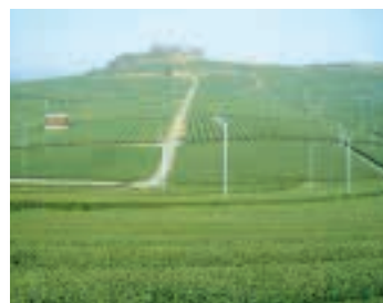
緑のウェーブが美しい八女中央大茶園

♪唄はちやつきり節 男は次郎長 花はたちばな 夏はたちばな 茶のかおり チャツキリ チャツキリ チャツキリよ 蛙が啼くんで 雨 ずらよ (静岡県民謡)