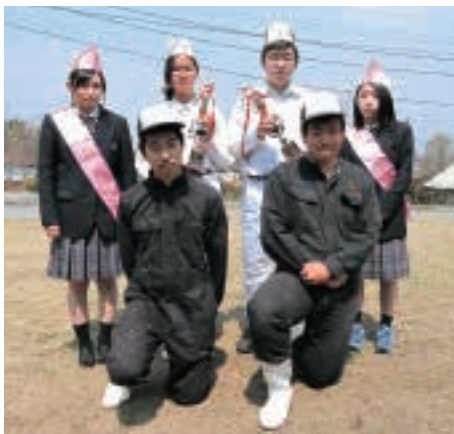
活躍した動物科学部員

出場した選手は「日頃の部活動の成果が認められ、大変うれしかった。秋の福岡県共進会に向け、さらに牛の手入れ・調教に頑張っていきたい。」と抱負を語っていました。