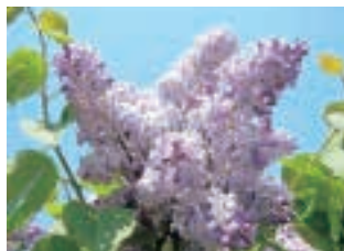
花名:ライラック(花色:白・むらさき・ピンクなど)、科名:モクセイ科、原産国:ヨーロッパ、樹高:4~8m、開花期:4~5月

今年の桜の開花一番は福岡県でした。桜も散った春の朝、今日は予定もないので、庭でも整理しようといざ外へ。さあ作業開始!と思いきや、桜の木を眺めて中断。あっ、葉桜になっちゃった。隣の木にはサクランボが沢山ついている。鳥たちに食べられちゃうぞー。間もなく毛虫が出る季節だな～なんて思いながら、まずは草むしりからスタート。草を抜いたら根っこと一緒にミミズが付いてきてここでも、季節の変わり目を知らせてくれる。毎年沢山の白い花を咲かせていたライラックの枝が葉っぱ一枚もなく残っている。気づいてはいたが、やっぱり可哀想...ノコギリを使い一枝切ってみた。