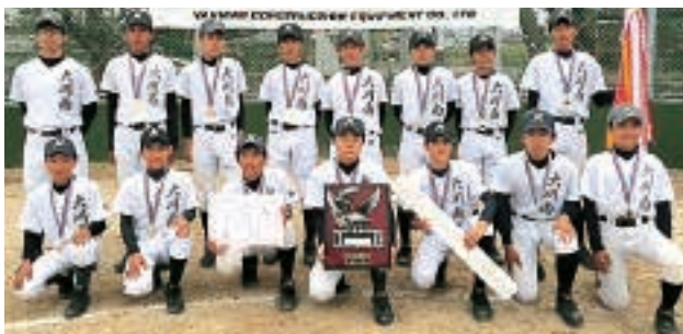
優勝校 大川南中学校(大川市)

ヤンマー建機杯第20回矢部川交流軟式野球大会はみやま、柳川、八女、筑後四市立中学校野球部27チームが参加して開催されました。試合結果は優勝大川南中学校(大川市)準優勝八女西中学校(八女市)でした。全力で戦ってくれた全選手の皆さん、大会開催にご尽力賜りました関係各位に心より御礼申し上げます。