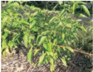
●4本の主枝が決まり、収穫期に入った甘長トウガラシ。*枝が実の重みで裂けないように、フラワーネットを畝面より60cm程の高さに設置している。畝面には、乾燥防止のために麦わらを敷いている。

これらの主枝に合わせて支柱を立てるか、高さ60cm程の高さにフラワーネットを張って、主枝が実の重みで裂けないようにします。4本の主枝を決めたら、それから以降は混み合っている部分の貧弱な側枝を間引いて、株全体に日が当たるようにします。