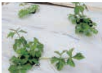
●株間35～40cmで植え付ける(条間は55cm)。8月中の植え付けならば、白黒ダブルマルチをしても良い。