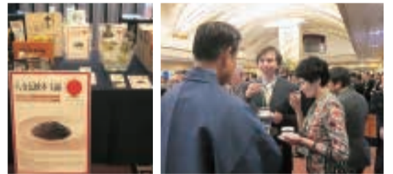
八女伝統本玉露PRの様子

八女伝統本玉露は、「だしパック（11×10.5cm）」一袋に玉露20gを入れ（詰めすぎると茶葉が水を吸ったとき膨らみが良くない）冷水400ccと硬い氷をやかんに入れて4時間、冷蔵庫で抽出して作った冷茶約20Lを使用しました。