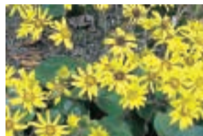
冬の陽に映える 石路の花