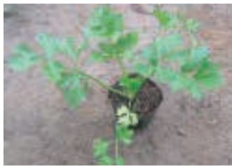
●畑に植え付け時期に達した苗(本葉7～9枚)